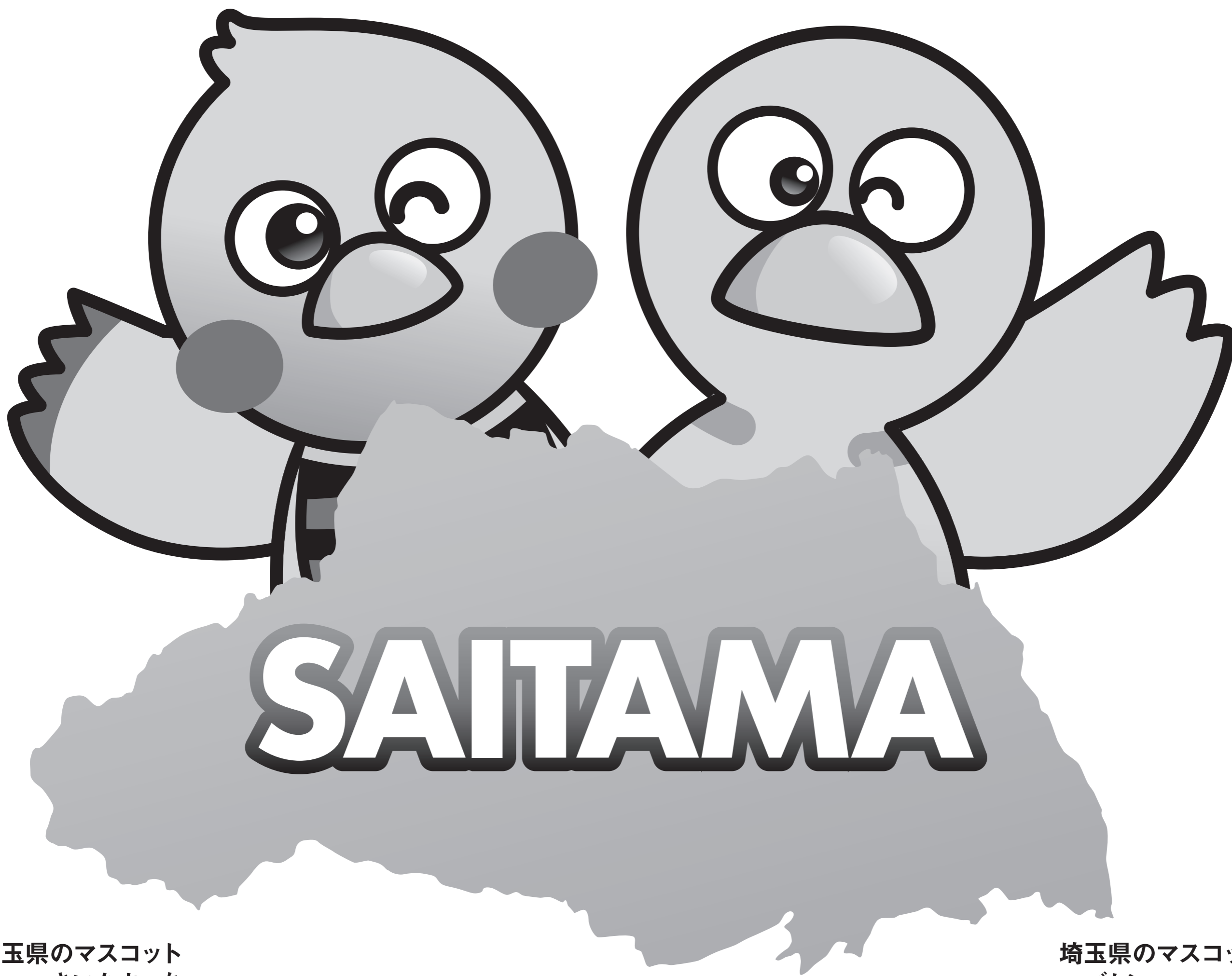
埼玉県のマスコット さいたまっち